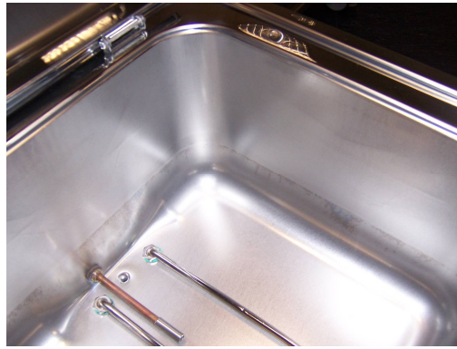
Spigoli/Angoli interni R=20