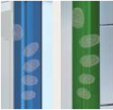
Colorazioni/trattamenti per identificazione e rilevazione macroimpurità